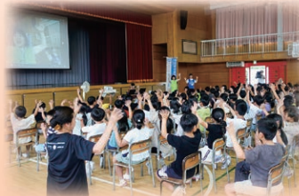
↑ 西小手話体験学習