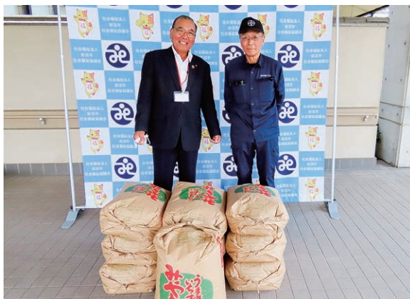
玉浦中部ファームさまより、新米とさつまいも各300kgを寄贈いただきました。↑↓