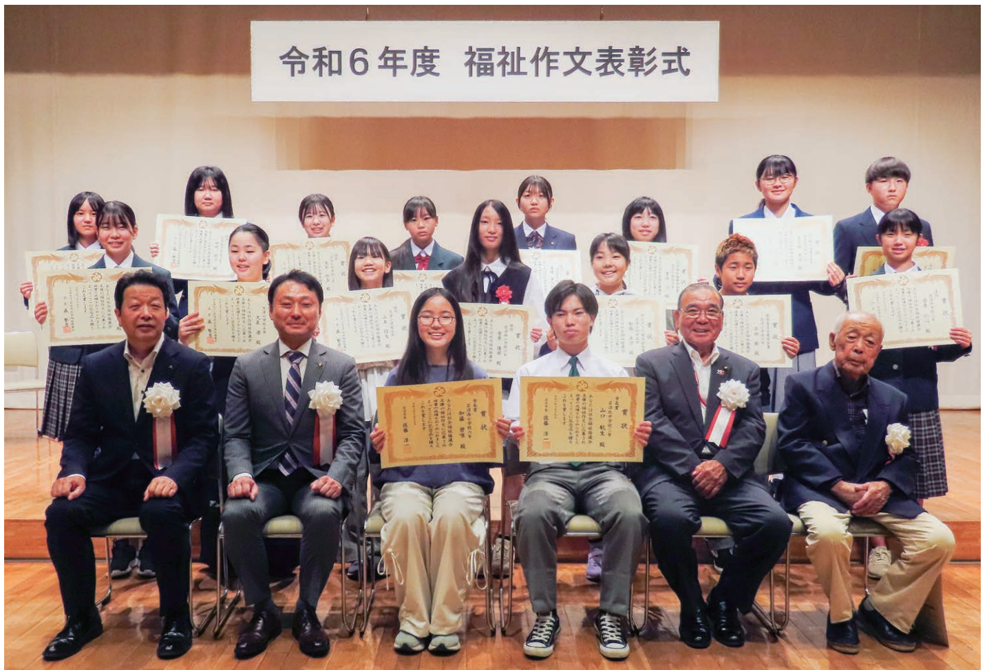
令和6年度 福祉作文表彰式

10月19日(土)、岩沼市民会館中ホールを会場に市内の小中学生を対象に募集した福祉作文の表彰式を行いました。詳細については、次ページをご覧ください。