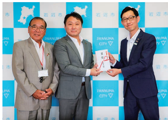
メガネの相沢岩沼店さまより、岩沼市を通じて老眼鏡調製券20名分をいただきました。