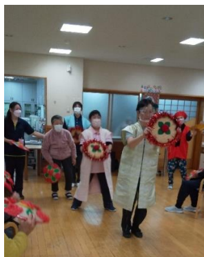
⑳新年会で花笠音頭を披露