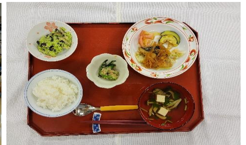
⑤収穫したズッキーニを使った昼食