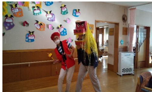
㉑獅子舞で疫病退治!

新型コロナウイルス感染予防対策のため、外部のボランティア団体の受け入れを見合わせておりました。行事の際は職員が踊りや歌などの特技を披露するなど、皆さんに喜んでいただけるように取り組みました。