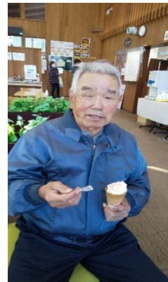
⑰外出先での楽しみ