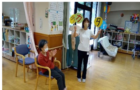
④お食事の前の口腔体操