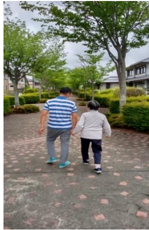
①天気の良い日はお散歩へ