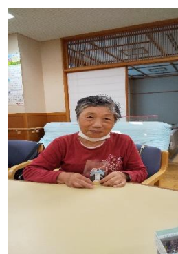
⑱⑲皆様の健康を願い、お守りをプレゼント