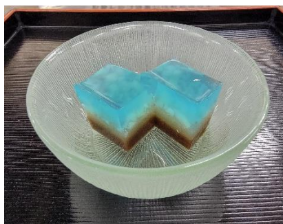
⑭天の川のイメージしたゼリー