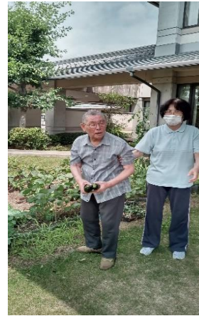
②ズッキーニの収穫