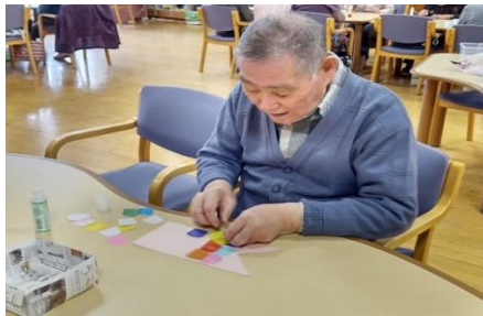
⑨鯉のぼりを作成中