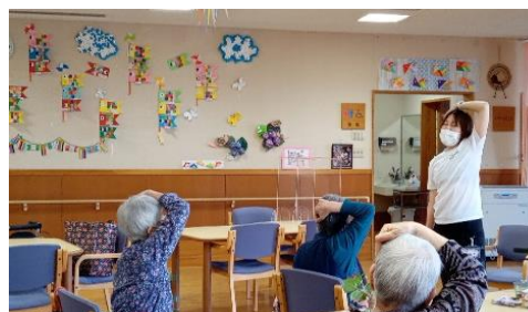
⑦リハビリも頑張っています