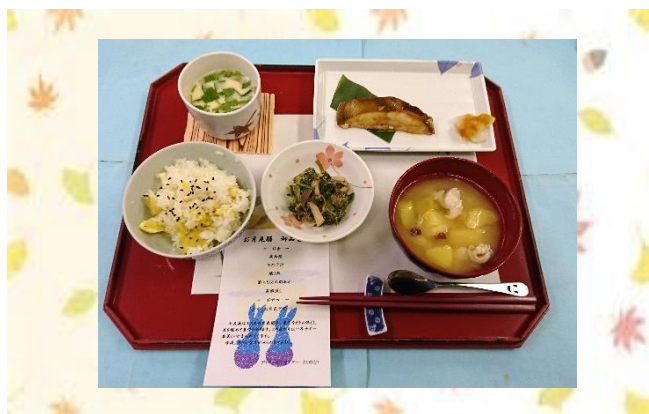
お月見御膳～栗御飯・芋の子汁他