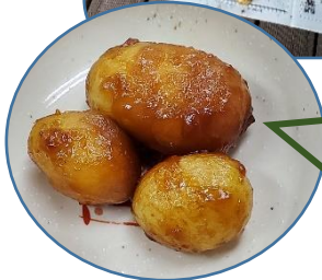
じゃがいもの甘辛煮