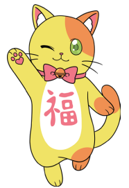
岩沼市社会福祉協議会 マスコットキャラクター ふくにゃん