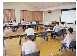
▲生活支援体制整備事業協議体