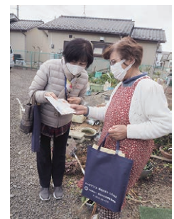
▲ひとり暮らし高齢者への生活支援