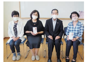
▲地域支え合い助成金