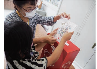
▲小学生ボランティア体験