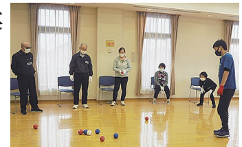
▲ボランティア養成講座